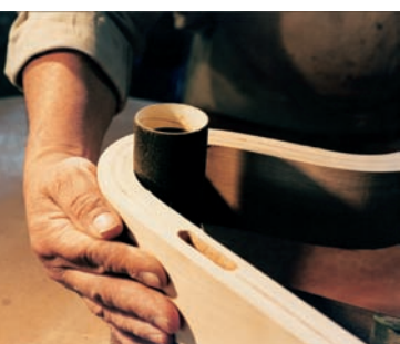
Pulido de pieza de madera laminada

Aplicación: Desbaste, rebabado, limpieza, retoque y pulido de acero, bronce, aluminio, mármol, vidrio, madera, resinas, etc.