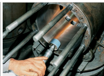
Retoque base de cilindro