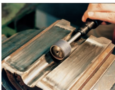
Desbaste de parísón